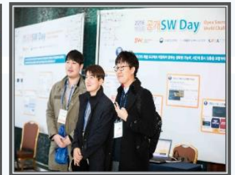
오픈소스 컨퍼런스 및 대회 수상작 전시